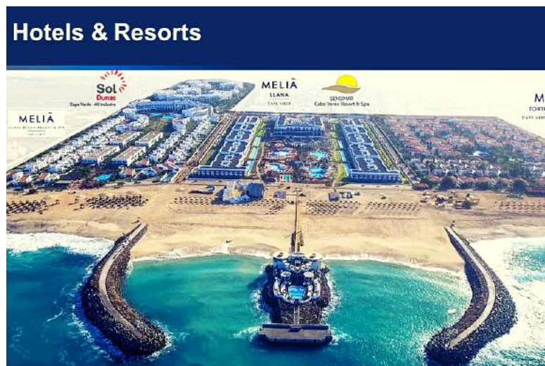
Melia Beach and Spa Resorts in Insula Sal

Peste acest procent, venituri indirecte se obțin din cele 5 săptămâni de vacanță gratuite pentru proprietar & familia lui și impozitul zero pe veniturile din turism, acolo.